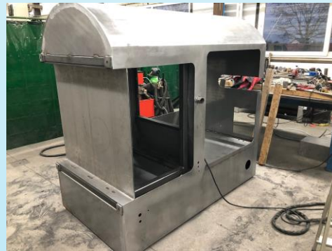
Carénage machine acier