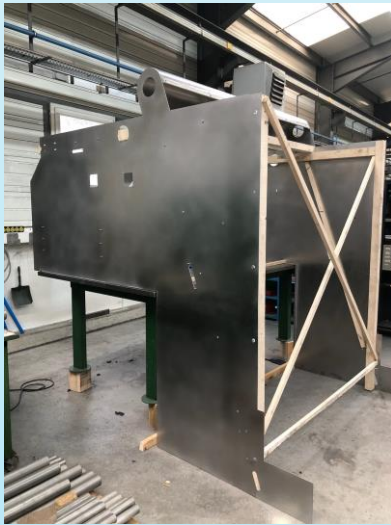
Capotage machine cosmétique

Plusieurs pièces uniques sont à nouveau sorties de nos ateliers au premier trimestre et cela a nécessité le savoir-faire unanimement reconnu de la SAS OUDOT. Un partenariat client a également été lancé sur le secteur automobile.