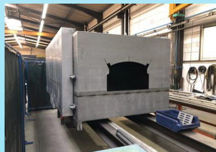
Four pour l'industrie automobile