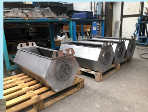
Cuves acier tonneaux ébavurage