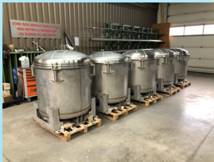
Cuves maturation inox