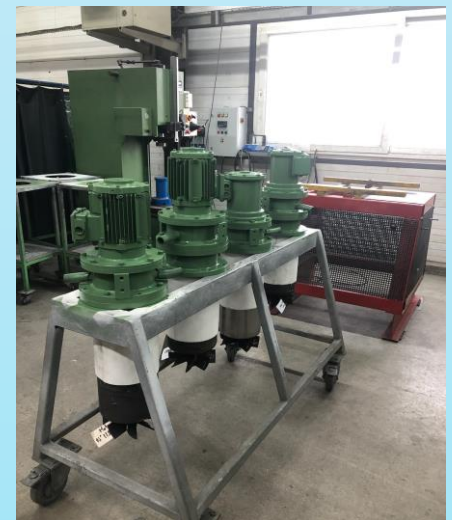
Réparation ventilateurs industrie automobile (Atelier client sur site Oudot)